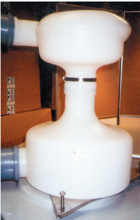
Séparateur d'eau, grand modèle